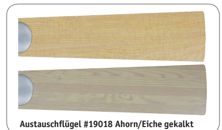
Austauschflügel #19018 Ahorn/Eiche gekalkt