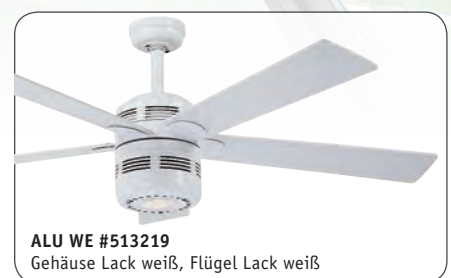
ALU WE #513219 Gehäuse Lack weiß, Flügel Lack weiß