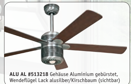
ALU AL #513218 Gehäuse Aluminium gebürstet, Wendeflügel Lack alusilber/Kirschbaum (sichtbar)

ALU AL #513218 Gehäuse Aluminium gebürstet, Wendeflügel Lack alusilber (sichtbar)/Kirschbaum